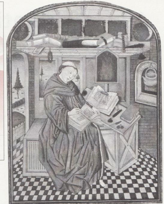
4 Un moine copiant un manuscrit (livre écrit à la main) dans son monastère. À cette époque, les pages étaient en parchemin (en peau d'animal) et non en papier.

A Observe le document 3 et décris ce croisé.