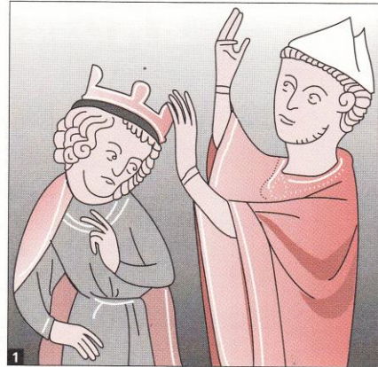
1 Le roi se fait couronner par un évêque. Il montre ainsi à ses sujets que son pouvoir est soutenu par l'Église.