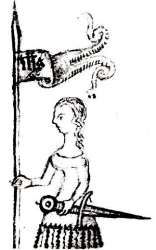
4 Jeanne d'Arc

3 Jeanne d'Arc est née à Domrémy en Lorraine en 1412. Elle travaille comme bergère. À l'âge de 17 ans, elle rencontre le roi de France, Charles VII. Elle lui dit qu'elle veut chasser les Anglais hors de France. Le roi lui confie une armée et elle libère Orléans. Mais elle est capturée et brûlée par les Anglais à Rouen, en 1431.