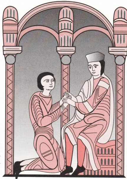
2 Un seigneur, à genoux, rend hommage au roi: il reconnaît son pouvoir et promet de lui obéir en toutes choses.